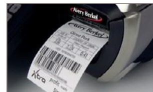
GS1 Databar nouvelle réglementation mondiale - GS1 étendu